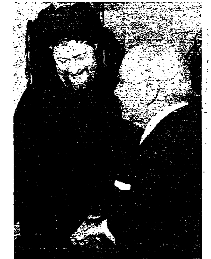
الرئيس سلاح يستقبل الامام الصدر في منزله بالمصيطبة

بعدها طرح مسحة الامام موسى الصدر شعار «حكومة قوية سرمدية» الذي تحمله مسؤوليتها الكاملة» وتشي الخلل الجذري للزفة الراهنة، زار مسحة مساء امس الرئيس صائب سلام وعرضه تفصيل الازمة - البقية على ص ١٢ عمود ٢ -